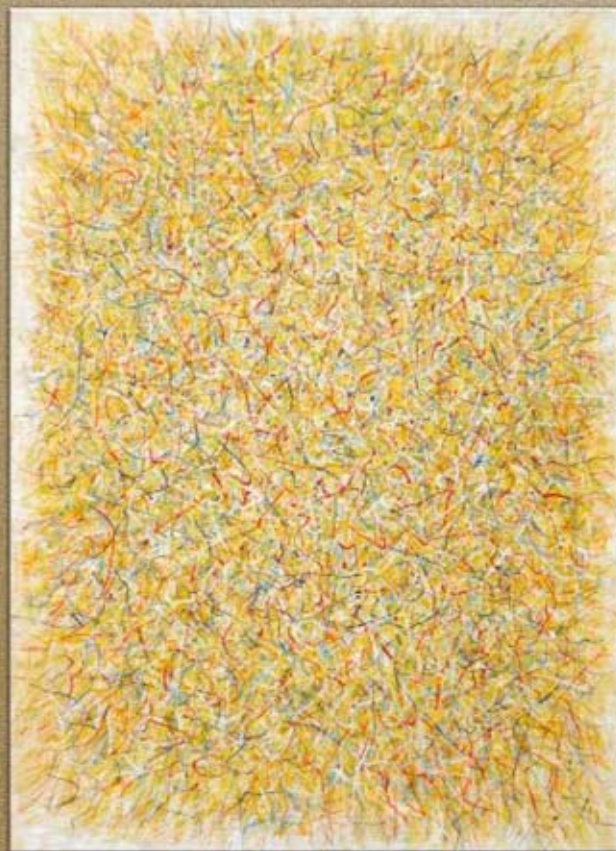
Linienfeld zart auf Gelb (farinoso) 1986 - Helmut Zimmermann