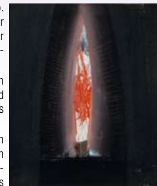
Ohne Titel - Helmut Zimmermann

So entstanden abstrakte Arbeiten in vibrierender Farbigkeit mit großer Tiefe.