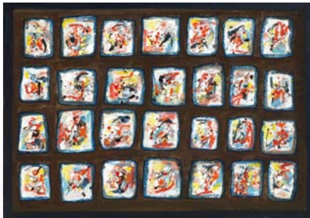
Bilbo -1990 Helmut Zimmermann